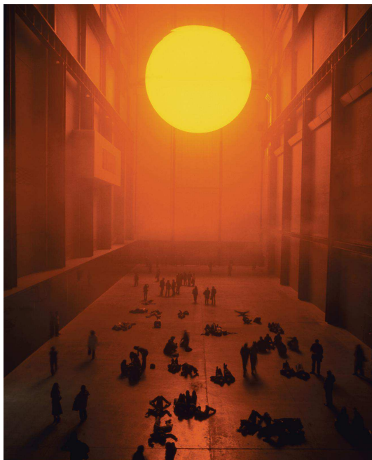
Olafur Eliasson, The Weather Project , Ampoules à monofréquence + cadres en aluminium + film miroir + brouillard artificiel, 2003