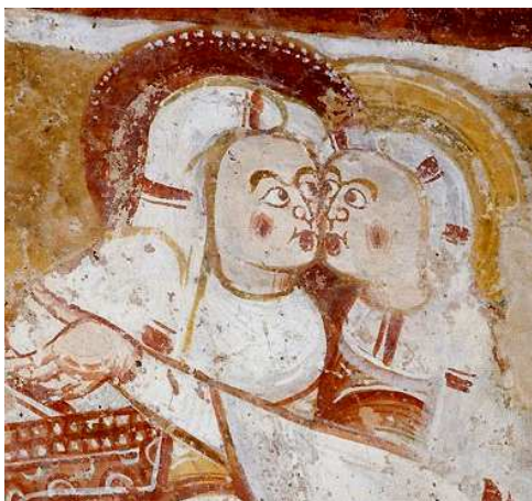
Église romane de Nohant-Vic, Élisabeth et Marie détail de La Visitation , fresque, XII e s.