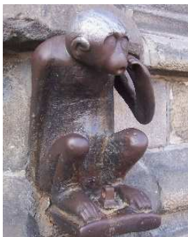
Le singe du grand'garde