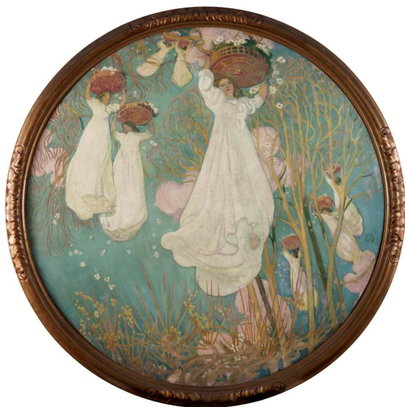
Maurice Denis, Avril , Tondo, plafond peint pour Ernest Chausson, 1894